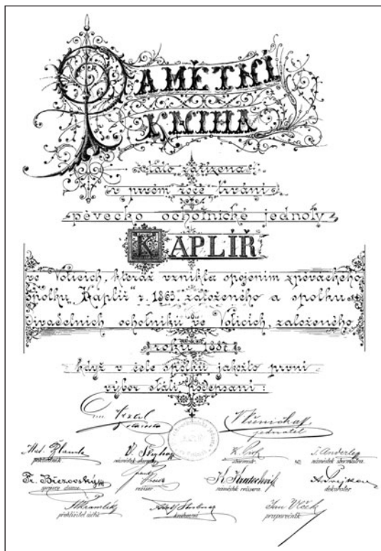
Úvodní list Pamětní knihy Pěvecko-ochotnické jednoty Kaplíř.

Dlouholetá pěvecká příprava přinesla své ovoce. Dne 23. ledna 1897 pořádá „Kaplíř“ Smetanův večer. Votické obecnstvo tehdy poprvé uslyšelo arie, dueta i sbory ze