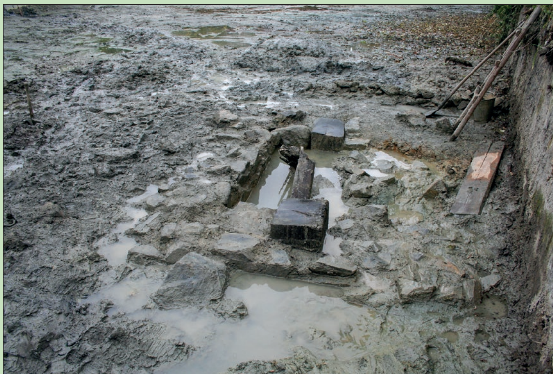
Boční pohled směrem k jihu.