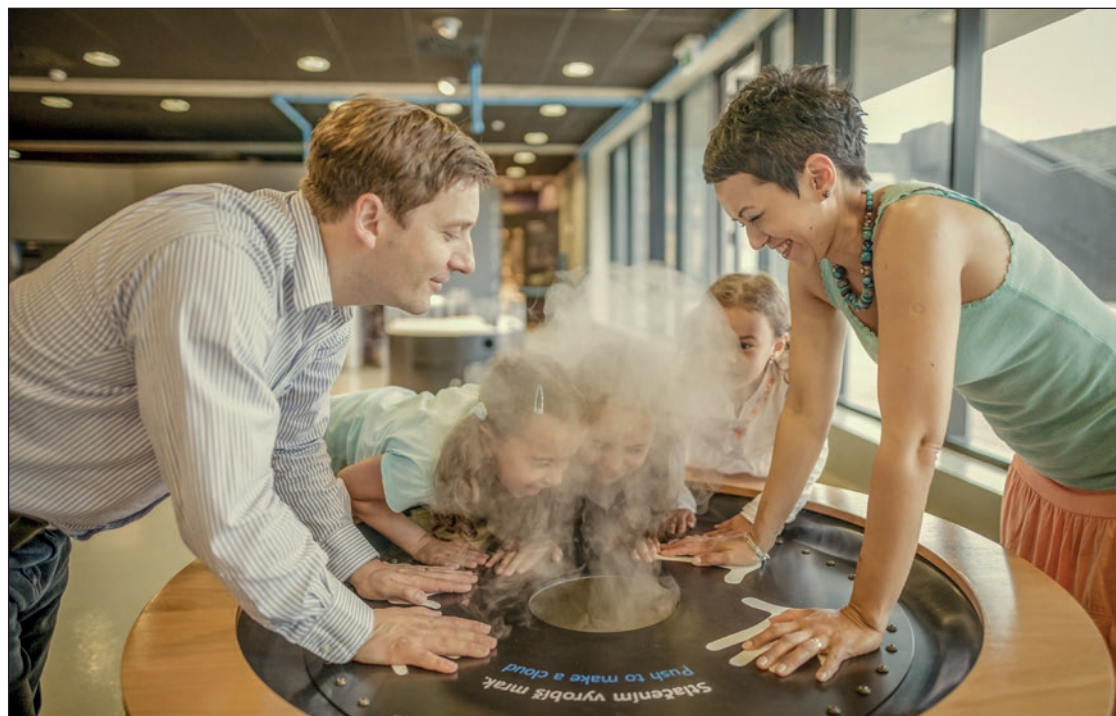
Ve Vodním domě si můžete prohlédnout také výrobek mraků (foto: V. Švajcr).