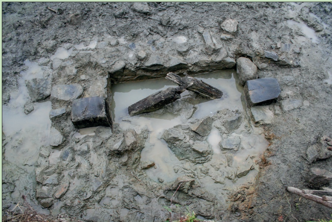
Očištěné dno se základem kamenné zdi, s níž lícuji uříznuté dubové trámy ztužené šikmými vzpěrami 18. 10. 2017.