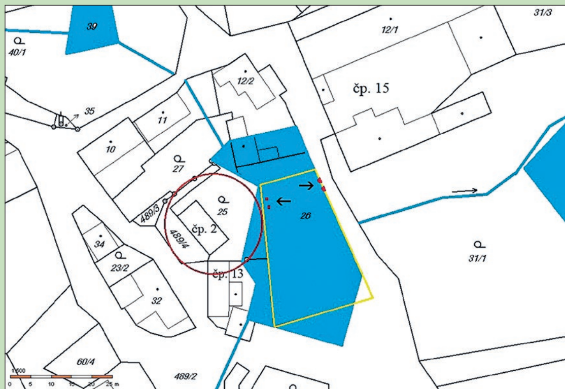
Katastrální mapa, modře vyznačen rozsah vodní plochy před úpravou rybníka, žlutě současný rozsah, šipky směřují na místa nálezů, tvrziště v kruhu.