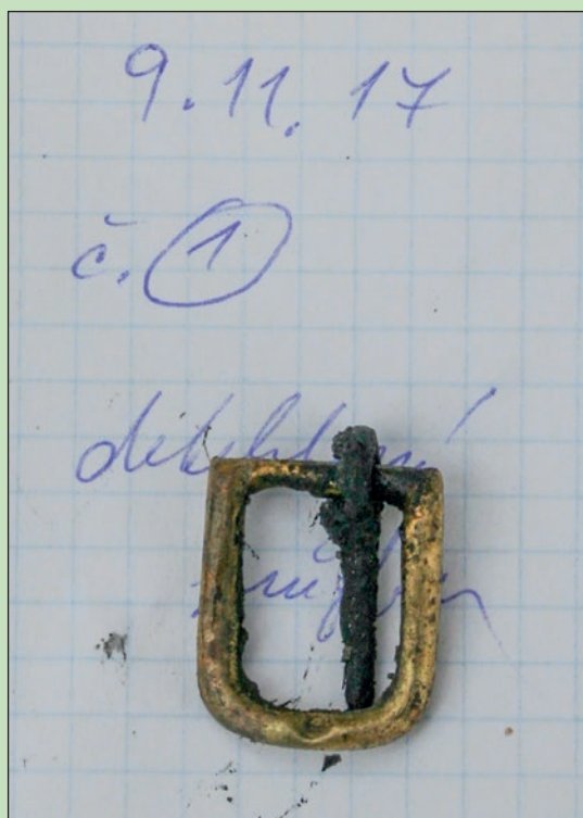
Středověká zlatá přezka.

protože porovnáním přírůstků letokruhů se dá velice přesně určit jeho stáří. Nejdůležitější je pak poslední podkorní letokruh, který určuje rok skácení stromu a to až s přesností na roční období daného roku. Díky dobře zachovaným trámům bylo možné odebrat vzorek pro dendrochronologické datování. Z odebraného vzorku se dalo vyčíst, že se jednalo o dub, který rostl více než 125 let. Poslední datovaný letokruh byl z roku 1311, k tomu je třeba přičíst 5 až 25 letokruhů bělového dřeva, které se nedochovaly. Datování jsme chtěli zpřesnit odběrem vzorku z dalších trámů, při jejichž očišťování jsme narazili na základovou zeď o tloušťce 70 cm spojenou na vápennou maltu, se kterou trámy lícovaly. Po odtoku vody a očištění dna rybníka se vyjevila velice zajímavá situace. Zdivo bylo založeno do kraje rybníka tak, že objekt vystupoval třemi zděnými stěnami do vodní plochy. Trámy zapuštěné do dna, které lícují se základovou zdí, byly navíc ztuženy šikmými vzpěrami – tzv. ondřejským křížem. (Trámy byly nejspíš při posledním čištění zkráceny v místě křížení tak, aby nepřekážely pracím.) Toto ztužení mělo jistě svůj konstrukční význam, kolmo zapuštěné trámy díky němu mohly být mnohem vyšší a mohly tvořit součást nějaké další konstrukce. Nepravděpodobnější se zdá vstupní objekt, snad brána, ke které přes vodní příkop nejspíš vedl dřevěný mostek. V okolí