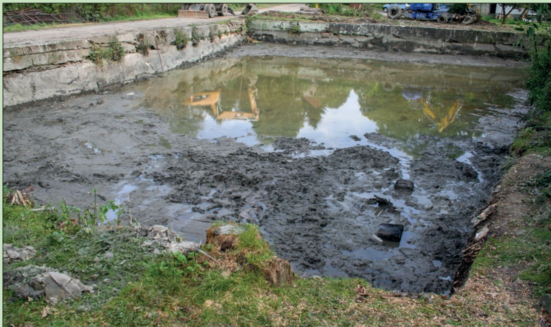
Stav po vypuštění rybníka, v dolním rohu očištěné zčernalé trámy zapuštěné do dna, 9. 9. 2017.